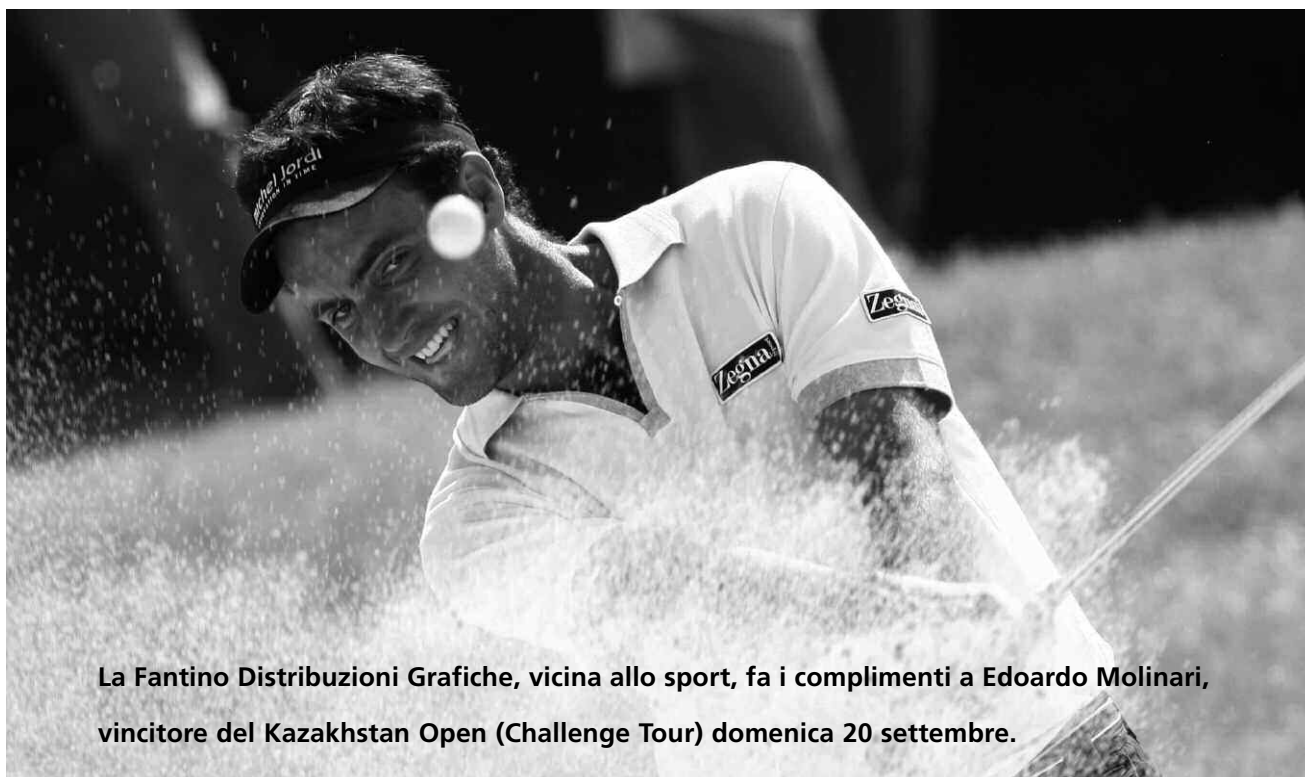
La Fantino Distribuzioni Grafiche, vicina allo sport, fa i complimenti a Edoardo Molinari, vincitore del Kazakhstan Open (Challenge Tour) domenica 20 settembre.